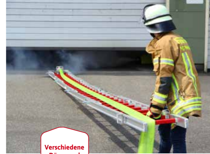
Verschiedene Düsen und Rollen