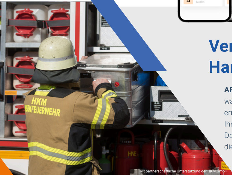
Mit partnerschaftliche Unterstützung der HKM GmbH